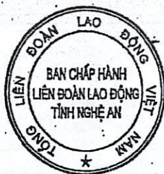
Mẫu số 36