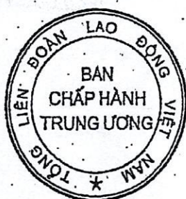
Mẫu số 35